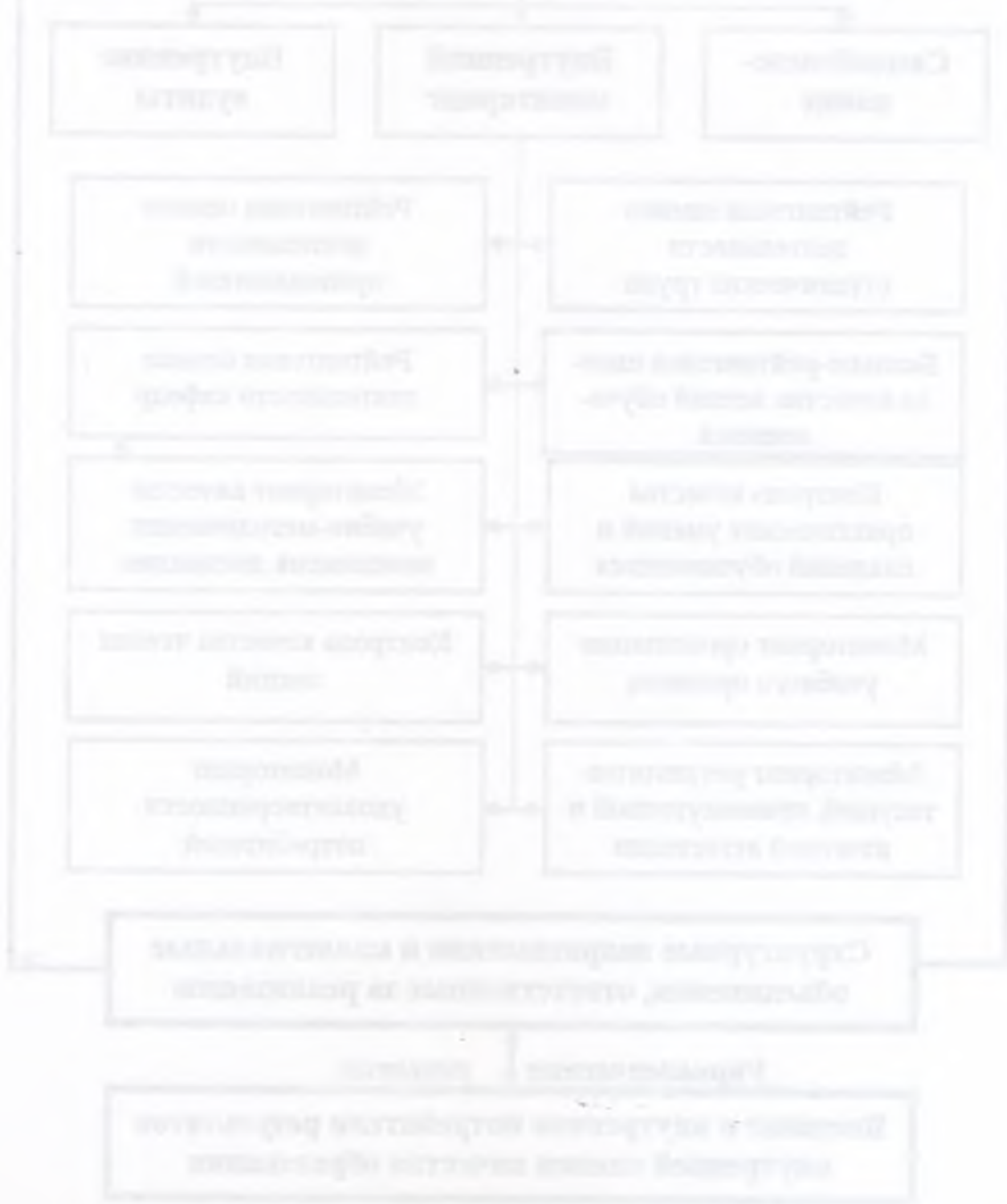
Рис. 1 - Структурная схема системы мониторинга ТWT

внутреннего мониторинга, порядок проведения которого регламентируется локальными нормативными актами по отдельным направлениям.