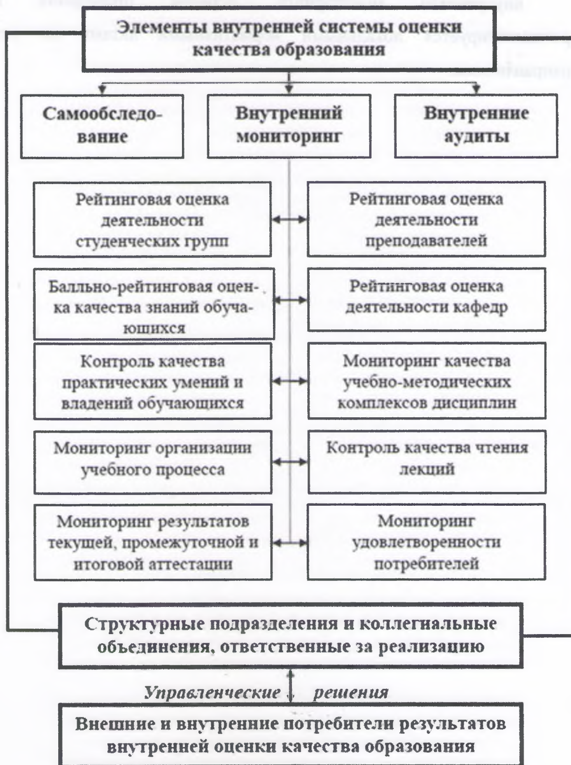
Рисунок 1 - Организационная структура внутренней системы оценки качества образования ТУТ