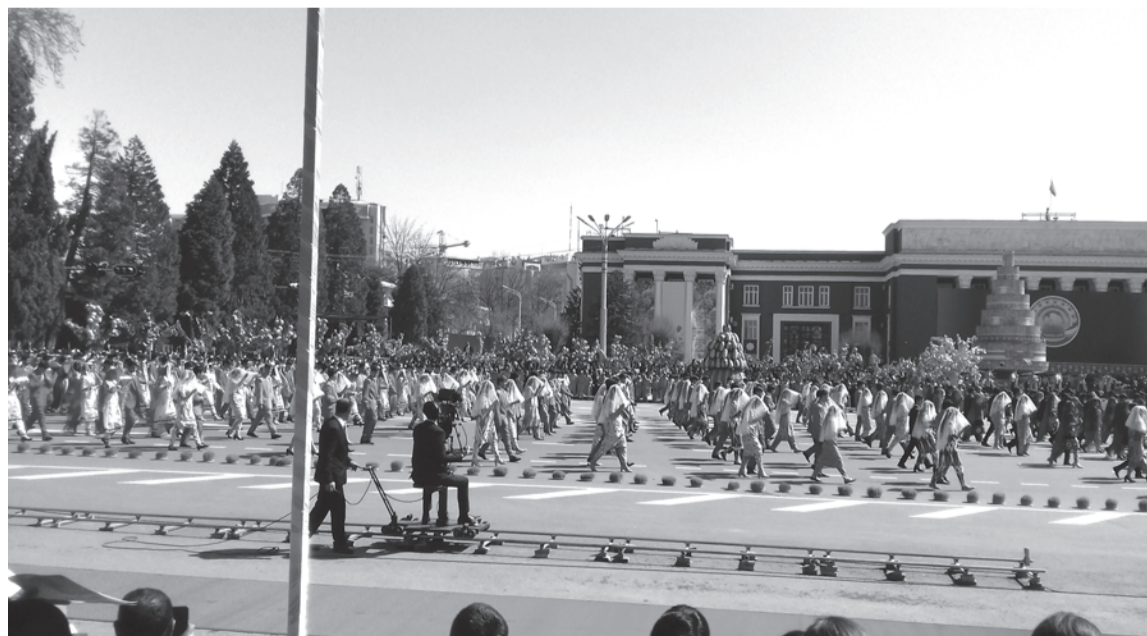
Дар бошукӯҳ гузаронидани чорабиниҳои фарҳангии шаҳриву ҷумҳуриявӣ донишҷӯёни донишгоҳ, бахусус гулдухтарон бо иштироки фаъолонаи ҳеш саҳми назаррас доранд. Аз ҷумла дар баргузори чорабини фарҳангӣ таҳти унвони "Корвони шодӣ", ки 21-уми март сурат гирифт, 200 нафар донишҷӯён (100 нафар писар ва 100 нафар духтар) ҳамчун домоду арӯс ширкат варзиданд.