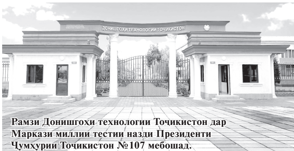
Рамзи Донишгоҳи технологияи Тоҷикистон дар Маркази миллии тестии назди Президенти Ҷумҳурии Тоҷикистон №107 мебошад.

Дар факултет 1 нафар барандаи Ҷоизаи давлатӣ барои олимону ва омӯзгорони фанҳои табиатшиносӣ, риёзӣ, дақиқ ва техникаӣ, 3-нафар Ҷоизадори давлатӣ байни олимони ҷавон ба номи И.Сомонӣ, 4 нафар омӯзгори сазовори патент оид ба ихтирооти Авросиёӣ, 14 нафар омӯзгори сазовори патентҳо оид ба ихтирооти Ҷумҳурии Тоҷикистон,