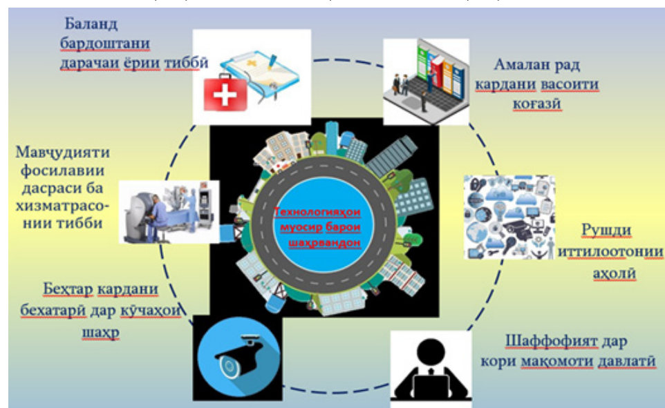
Самаранокии табили рақамии давлатӣ

Дар шароити ба таври мусбат амалишавии рушди иқтисодиёти рақамӣ дар Ҷумҳурии Тоҷикистон мушкилоти зиёде вучуд дорад. Низоми яғ-