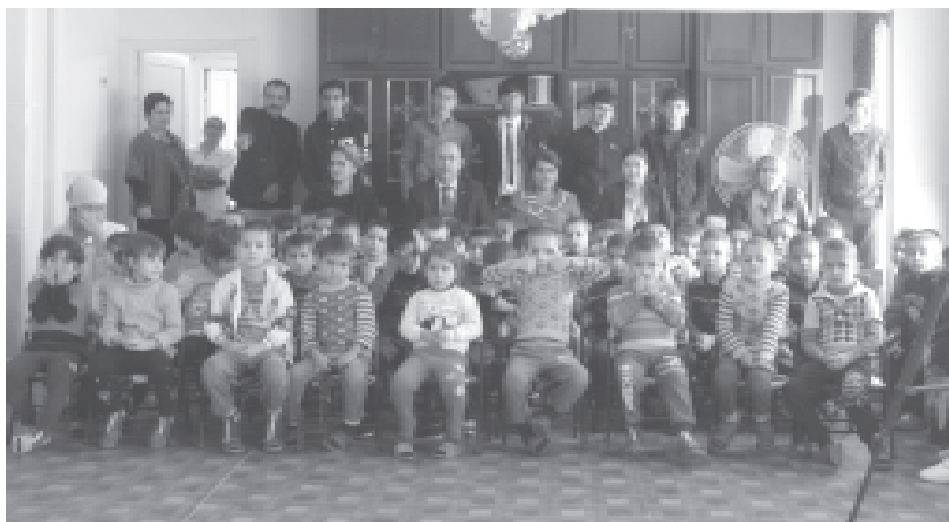
Аъзоёни департаменти қорҳои тарбиявӣ дар арафаи қашну идҳо зуд-зуд ба ҳонаи ятимон ва ҳона-интернати кӯдакони маъҷуб рафта, дар баробари супоридани тухфаҳои хотири онҳоро бо рақсу музӯҳҳои дилнишини шод мегардонанд.

фар маъҷубони гурӯҳи 1,2,3 бо идропулӣ дар ҳаҷми 130 сомонӣ таъмин карда шуданд.