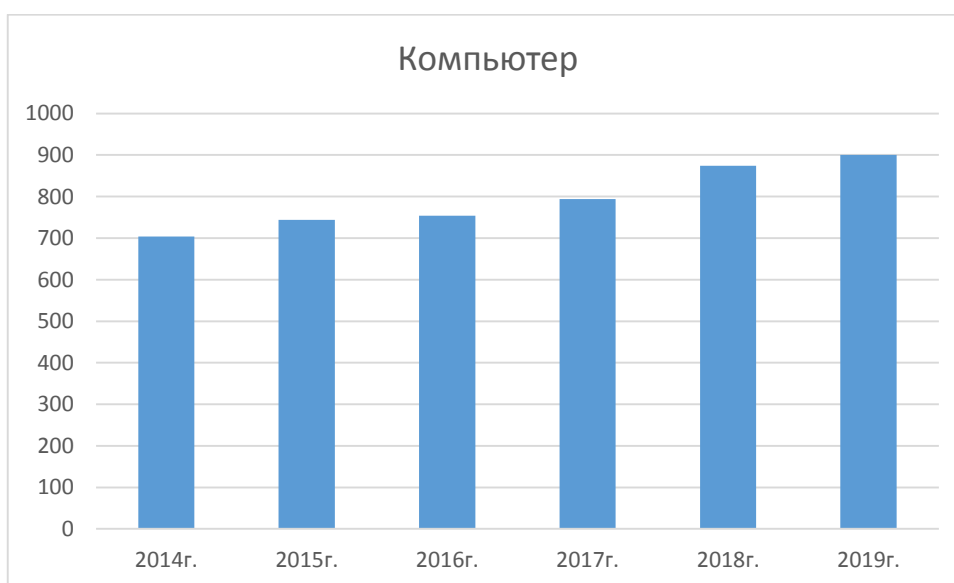
Рисунок 1. Динамика количество компьютеров за 2014-2019 годы